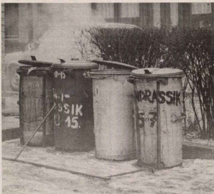
Az ügy teljesen véttlen főszereplői